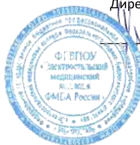
ГРАФИК ДЕЖУРСТВА ГРУПП

С 12.11.2018 г. по 17.11.2018 г. – группа 1.4