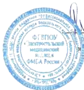
ГРАФИК ДЕЖУРСТВА ГРУПП

С 03.09.2018 г. по 08.09.2018 г. – группа 2.1