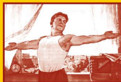
Ведите здоровый образ жизни