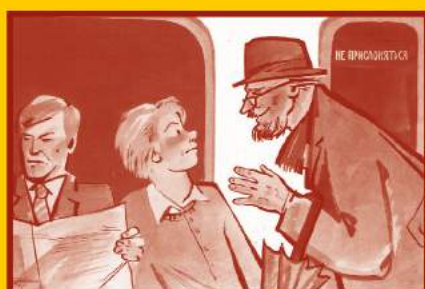
Ограничьте пребывание в местах скопления людей