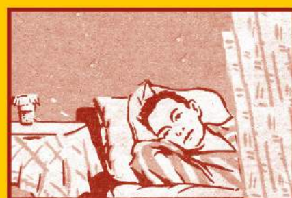
Избегайте контактов с заболевшими