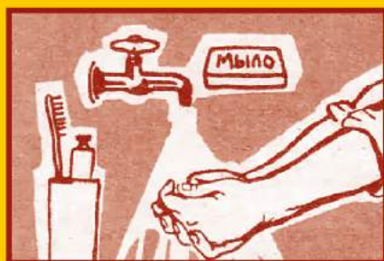
Регулярно мойте руки